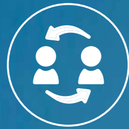
CHANGE MANAGEMENT MINDSET CHANGE