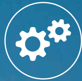
PROZESSAUDIT & PROZESSOPTIMIERUNG